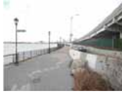
写真3 Manhattan 14th Street周辺 (図6参照) (点線は浸水痕。地盤から1.3m)