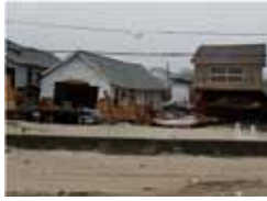
写真4 Breezy Pointにおける高潮による家屋の被害