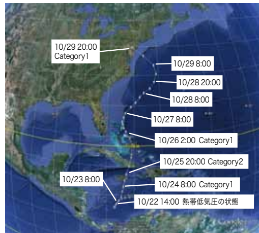
図2 ハリケーン・サンディ経路 (出典: 経路NOAA*1, 地図Google. 時間は米国東部夏時間。)

は8カ国(米国、ハイチ、キューバ、バハマ、カナダ、ドミニカ共和国、ジャマイカ、プエルトリコ)で300名以上とも言われており非常に多い。米国の被害金額は少なくとも500億ドル(約5兆円)と言われており、これは米国東海岸においてハリケーン・カトリナ(約1089億ドル)に次ぐ被害額である。