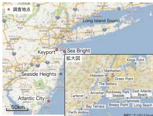
図1 現地調査を行った場所

【調査行程】 12月7日: The Port Authority of New York & New Jersey訪問、情報収集。 12月8～12日: ニューヨーク州、ニュージャージー州調査。