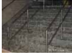
写真2 被災時のHoboken PATH Station (図6参照)