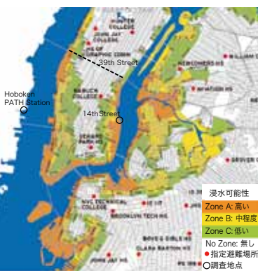
図6 ニューヨーク市内周辺のハリケーン・サンディによる浸水予想図、指定避難場所と調査地点

Manhattanの周辺にはJFK国際空港とNewark国際空港、LaGuardia空港、Teeterboro空港といった4つの空港があるが、ハリケーンの影響ですべての空港が一時閉鎖した。また、LaGuardia空港ではターミナルの広い範囲が浸水し、ハリケーン通過後の11月2日まで営業再開できなかった。JFK国際空港やTeeterboro空港においても部分的に浸水被害を受けた。