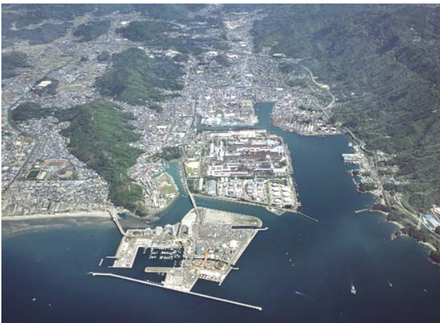
写真-1 和歌山下津港海南地区