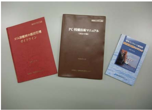
写真-1 発刊した書籍及び資料

Key Words : technical standard, PIANC, fairways, ISO/CEN, CPR, conformity assessment