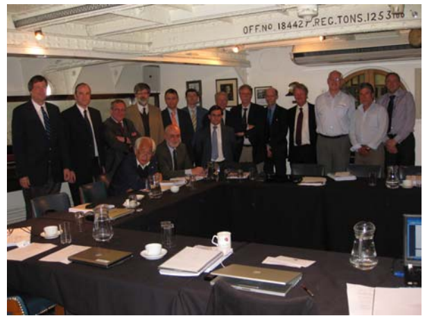
写真-2 第10回 PIANC/WG