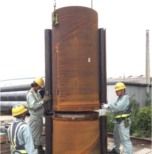
ラクニカンジョイント（ステップ型） の施工状況

適用杭工法は、従来の打撃工法、振動工法、埋込み杭工法（中掘り杭工法〔セメントミルク噴出攪拌方式、コンクリート打設方式、最終打撃方式〕、鋼管ソイルセメント杭工法等）、回転圧入杭工法および圧入工法に加え、ダウンザホールハンマ工法にも適用可能である。これにより、溶接継手に代わる機械式継手として、作業負荷の軽減、施工時間の短縮および品質の安定化が図られる。