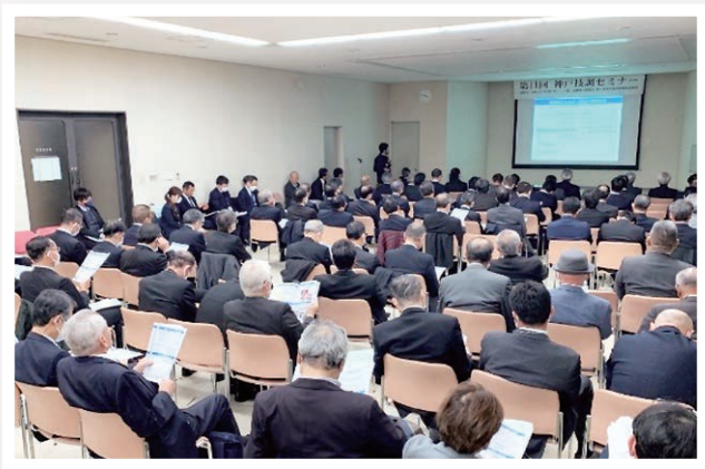
「第11回 神戸技調セミナー」開催状況写真

神戸技調と民間企業をつなぐイベントとして、神戸技調の取り組みを民間企業に紹介する「神戸技調セミナー」を令和5年12月6日に開催しました。このイベントは約4年ぶりの開催となります。募集定員を超える来場者があり、会場は盛況でした。