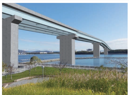
姫路港 広畑地区臨港道路(網干沖線)のフォトモンタージュ (網干沖地区から広畑地区に向かって)