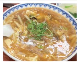
「唐子」の酸辣湯麺

新幹線で立ち寄られた方は、新神戸駅近くにある「布引の滝」もおすすめです。日本3大神滝の一つで、秋は紅葉と重なり絶景となります。また、その水質はかつて「赤道を越えても腐らない美味しい水」と評判で、神戸港に立ち寄った船に多く給水された歴史を持ちます。